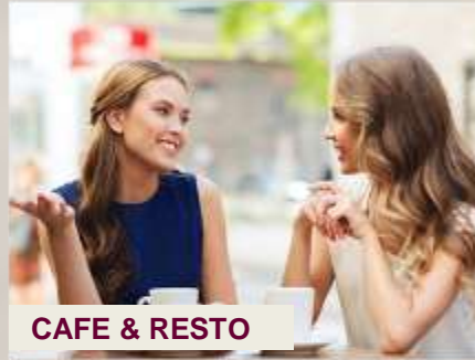
CAFE & RESTO