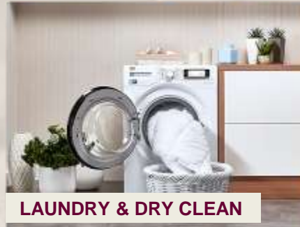
LAUNDRY & DRY CLEAN