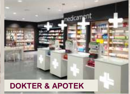
DOKTER & APOTEK